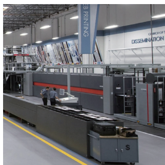
Centre de distribution