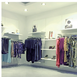
Venta al detalle