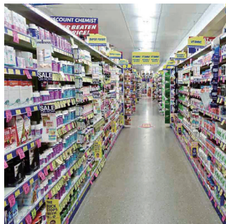
Venda a retalho