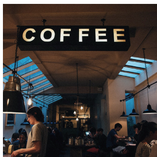
Hotelaria e restauração